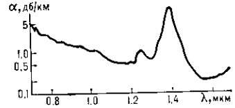
Рис. 4. Спектр оптических потерь одномодового волоконного световода.

Примесное поглощение в указанном спектральном диапазоне определяется гл. обр. поглощением ионами переходных металлов (Fe, Cu, Cr, Ni, V и др.) и гидроксильными группами. Чтобы поглощение света не превышало неск. дБ/км, содержание переходных металлов и гидроксильных групп в стекле не должно превышать неск. частей на 1 миллиард ( 10^{-9} ) и 1 миллион ( 10^{-6} ) соответственно. Вклад указанных примесей в полные потери совр. ВС пренебрежимо мал. Полные потери ВС на основе кварцевых стёкол близки к предельно низким (рис. 4).