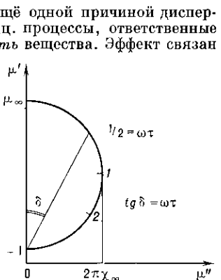
Рис. 3. Диаграмма Аржана (или Коле и Коле) зависимости \mu' = f(\mu'') .