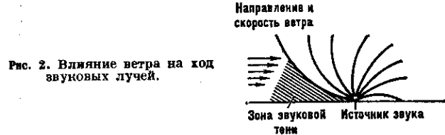
Рис. 2. Влияние ветра на ход звуковых лучей.

В приземном слое атмосферы скорость ветра с высотой увеличивается. Поэтому при распространении звука против ветра лучи загибаются кверху, а при распространении по ветру — к земной поверхности, что значительно улучшает слышимость во втором случае (рис. 2). Распределение ветра оказывает также существ.